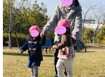
★お散歩と制作の様子

新春のお慶びを申し上げます。 新しい一年が、ご利用者様にとって、またご家族様の皆様にとって笑顔がたくさんの年になりますよう、お祈り申し上げます。